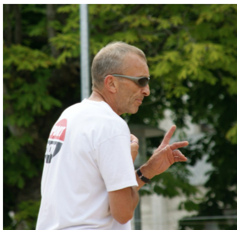
Philippe PROUST

Et bien c'est du handball de plage, la règle est simple, 3 pas, une passe. Pas de dribble car pas de rebond. Et bien sur marquer des buts. 1 but classique compte 1 point mais ces points peuvent être doubler ou tripler si les joueurs font des figures pour marquer. Le must reste bien sur le « kung fu ». Les points sont à l'appréciation de l'arbitre.